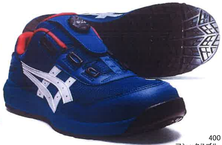
400 アシックスブルーxホワイト