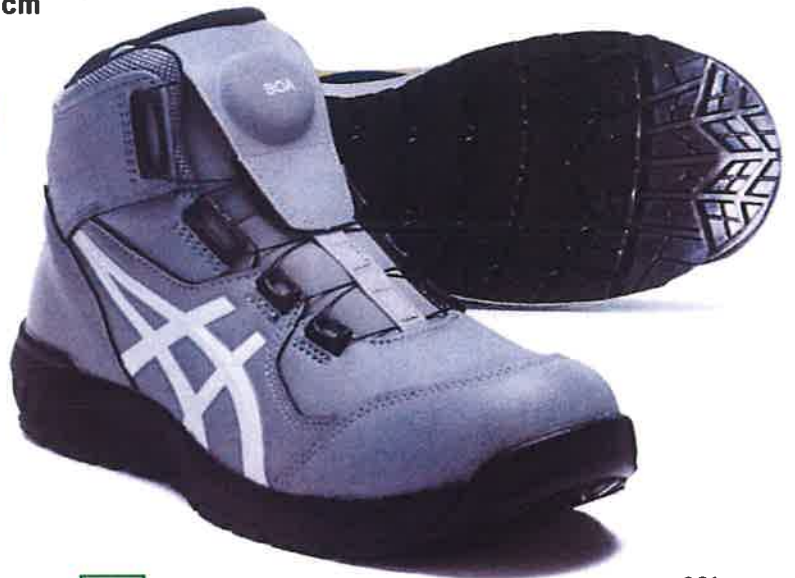
021 シートロックxホワイト