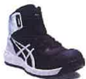
001 ブラックx ホワイト