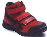
601 クラシックレッド× ブラック