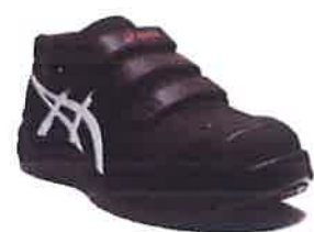
001 ブラックxホワイト