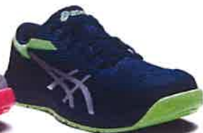
401 ピーコート× ピュアシルバー

① 通気性と耐久性を兼ね備えた、 ポリウレタン樹脂アッパーを採用。 スマートなワーキングシューズに。