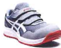
020 シートロック×ホワイト