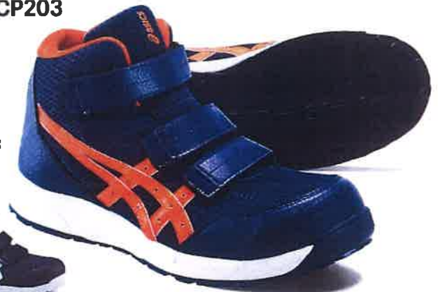
400 ピーコート×ショッキングオレンジ