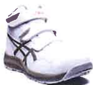
100 ホワイト×ライケングリーン