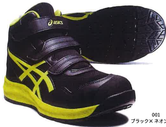
001 ブラック×ネオンライム