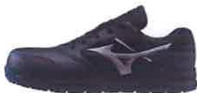
09 ブラック×ダークシルバー