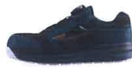
33 グリーン×ゴールド