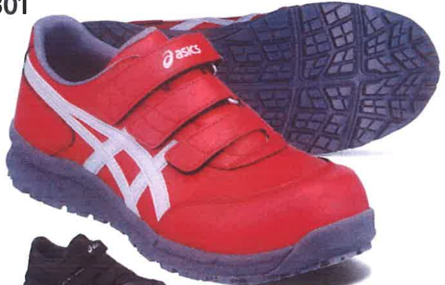
600 クラシックレッド×ピエドモントグレー