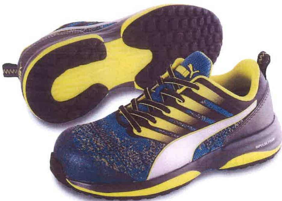
Charge Green Low チャージ・グリーン・ロー No.64.212.0

Charge Green Low iF デザインアワード 2020 プロダクトデザイン部門受賞