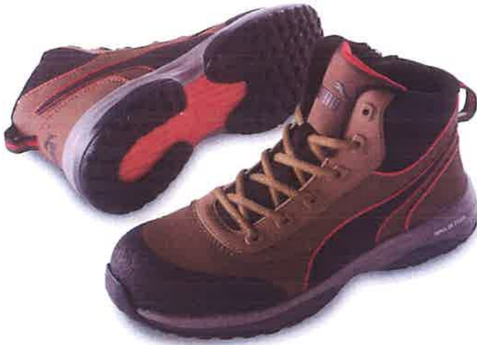
Rapid Brown Mid ZIP ラビッド・ブラウン・ミッド・ジップ No.63.554.0

[6SIZE] 25.0/25.5/26.0/26.5/27.0/28.0 [WIDTH] EEE JAN→P.19