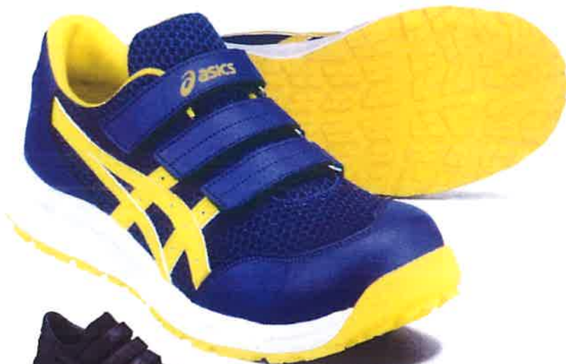
501 ジェントリパープルxヴァイブラントイエロー