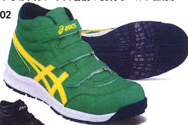
300 シラントロ×ヴァイブラントイエロー