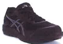
001 ブラック×キャリアグレー