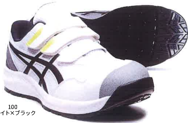
100 ホワイト×ブラック

軽量性、クッション性に優れた FLYTEFOAMを採用した、 走り出したくなるワーキングシューズ。