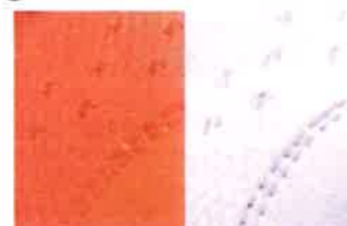
②フィルムコーティングメッシュ

通気性、耐久性に優れた フィルムコーティングメッシュを採用し、 メッシュのほつれを軽減。