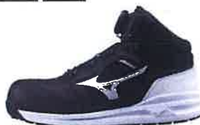
09 ブラック×ホワイト