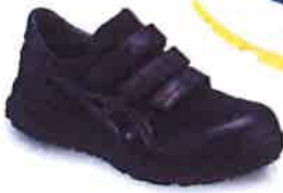
9090 ブラックx ブラック