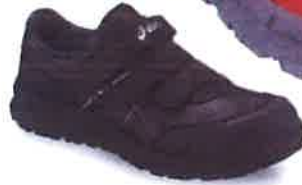
9090 ブラック×ブラック