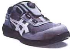
026 シートロックxホワイト