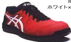
600 クラシックレッド×ホワイト TGR TEAM ZENT CERUMO 採用モデル