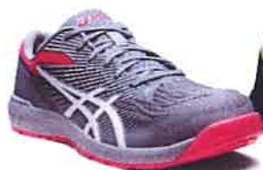
020 シートロック× ホワイト