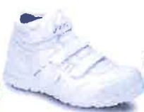
100 ホワイト×ホワイト