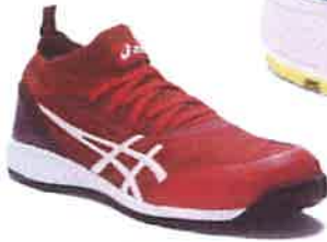
600 ファイアリーレッド× ホワイト