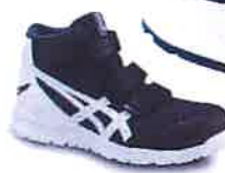
1601 ファントム× ホワイト