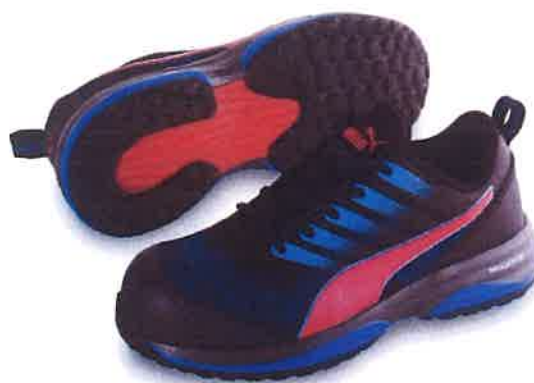
Charge Blue Low チャージ・ブルー・ロー No.64.211.0