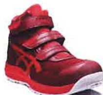
600 ビートジュース×クラシックレッド