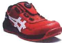
602 クラシックレッドxホワイト