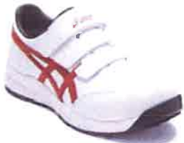
102 ホワイト× クラシックレッド