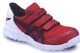
2390 クラシックレッドx ブラック