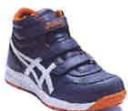
021 メトロポリス×ホワイト