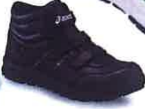
9090 ブラック×ブラック