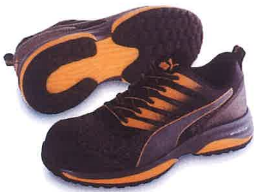
Charge Orange Low チャージ・オレンジ・ロー No.64.210.0