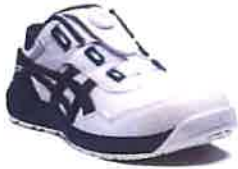
102 ホワイトxピーコート