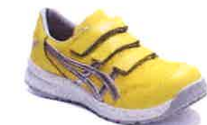
753 ヴァイブラントイエローx ピュアシルバー