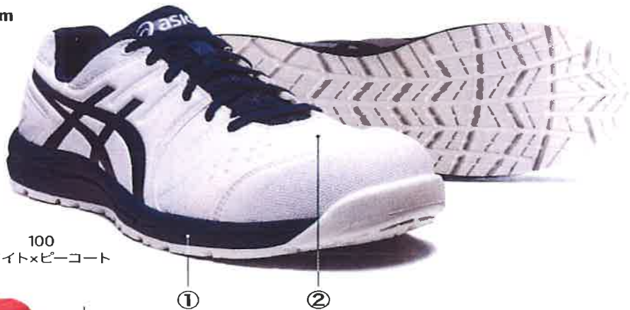
100 ホワイト×ピーコート