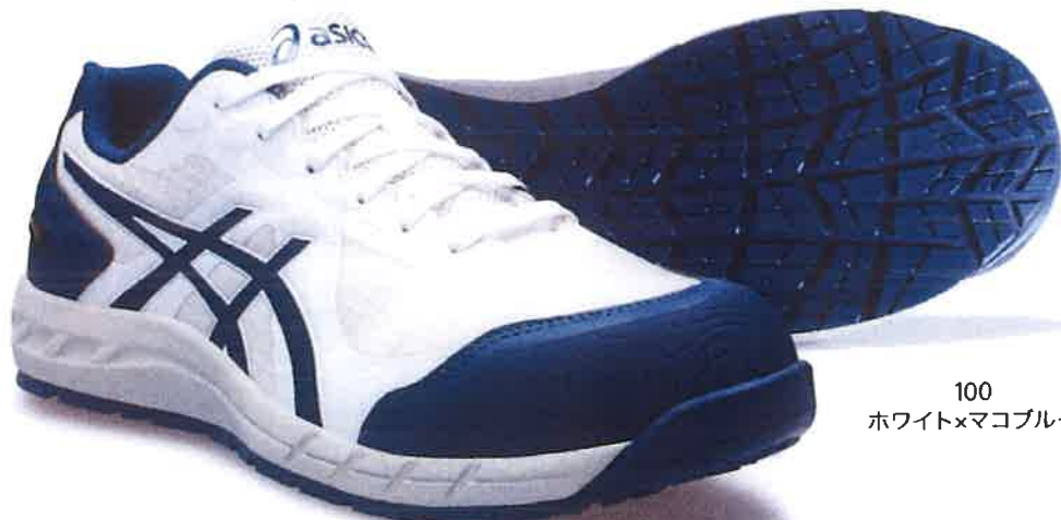
100 ホワイト×マコブルー