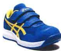
400 ディレクトワールブルー× ヴァイブラントイエロー