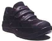
001 ブラック×ブラック