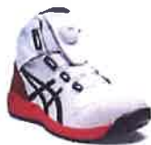
100 ホワイトx ブラック