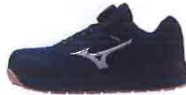
14 ネイビー×ホワイト