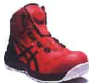
600 クラシックレッドx