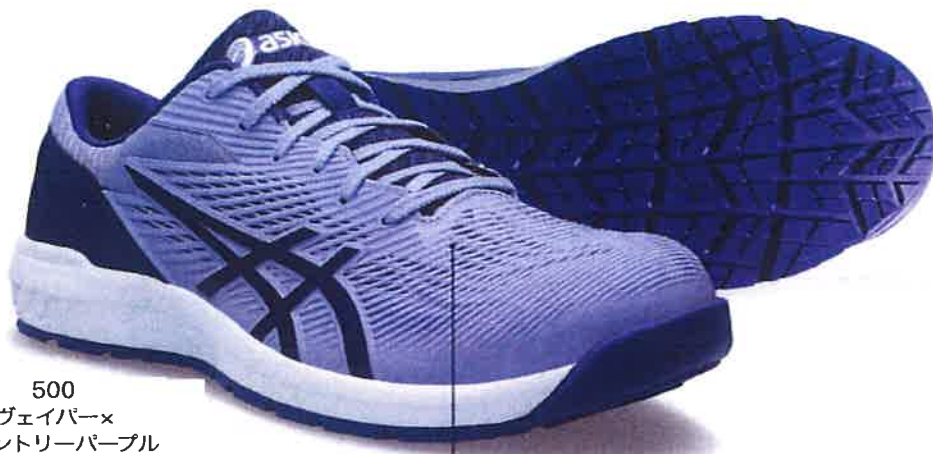
500 ヴェイパー× ジェントリーパープル