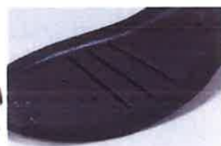
①ミッドソール屈曲溝