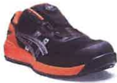
025 ファントムxシルバー