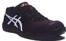
001 ブラック×ホワイト