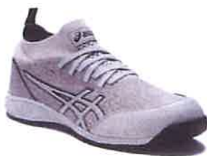
020 グリアグレー× ピエドモントグレー