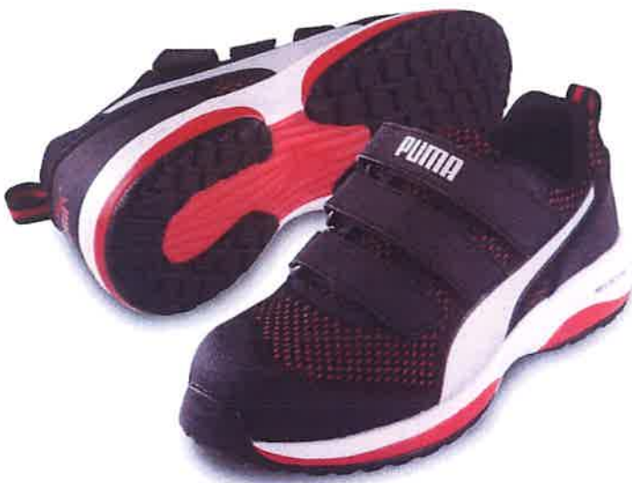
Speed Red Low スピード・レッド・ロー No.64.213.0

[6SIZE] 25.0/25.5/26.0/26.5/27.0/28.0 [WIDTH] EEE JAN→P.19