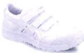
0101 ホワイト×ホワイト