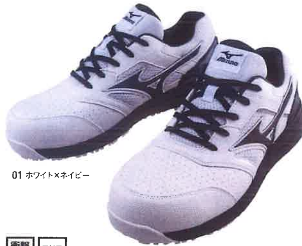
01 ホワイト×ネイビー